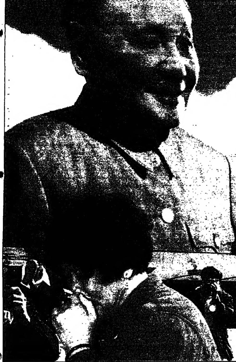
سيدة صينية تقف أمام صورة للزعيم الصيني الراحل ديمغ شياو بينغ